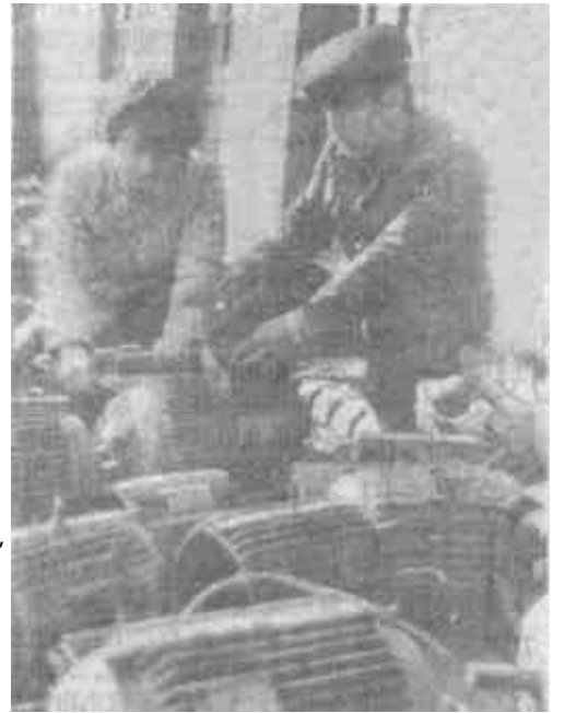
市造纸厂富了不忘勤俭持家，专门成立了回收、修理废旧设备班，仅修理阀门和电机每年就可节约资金5万余元。图为修理工在检修电机。

紧紧依靠全厂职工，建立和完善了各项规章制度，全面推行职工民主管理。在此基础上，狠抓产品质量，厂里成立了由厂长、车间负责人组成的全面质量管理委员会，车间建立了产品质量检验小组，全厂上下形成了严密的质量管理体系。另外，这个厂还在关键生产工序设立质管点，采取产品质量“倒查制”的方法，实行质量否决权，使产品合格率达到100%，优质产品率保持在98%以上。与此同时，厂里把生产质量、销售服务结合起来，及时交货，保证合同履行，受到外商的好评和省外贸部门的表彰。(范宝苍)